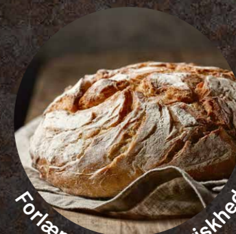
Forlænger naturlig friskhed