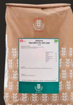
Øko Reform Hvedemel m. FK 10% N+ 10 kg Varenr. 142481

*Havreskoldning: 325 g Havregryn + 175 g revet æble + 900 g kogende vand.