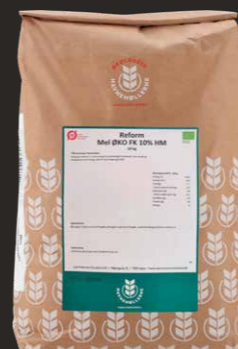
Øko Reform Hvedemel m. FK 10% N+ 10 kg Varenr. 142481

*Havreskoldning: 300 g Havremel 1501 + 900 g kogende vand