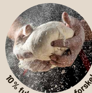
10% fuldkorn gør en forskel