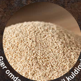
Gær omdanner sukker til kuldioxid

Når processen får lov at ske i sit eget tempo, opnås et friskere brød og en mere behagelig spiseoplevelse – helt uden brug af tilsætningsstoffer.