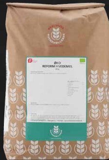
Øko Reform Hvedemel 10 kg Varenr. 141554