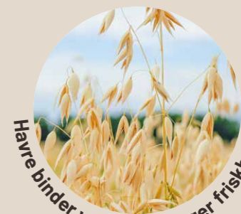
Havre binder vandet, der øger friskheden