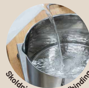
Skoldning øger vandbinding

Når tid og teknik gør arbejdet. God struktur, lang friskhed og høj saftighed opstår ikke tilfældigt. De opstår, når man arbejder med naturlige processer som: