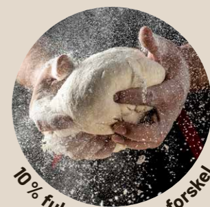
10% fuldkorn gør en forskel