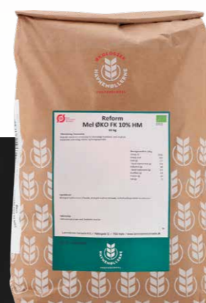
Øko Reform Hvedemel m. FK 10% N+ 10 kg Varenr. 142481