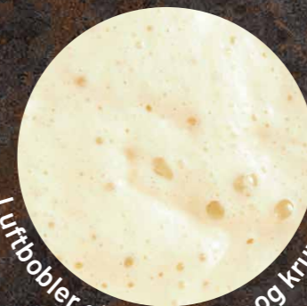
Luftbobler giver volumen og krumme