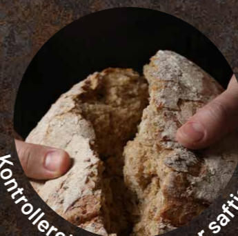
Kontrolleret hævning giver saftighed