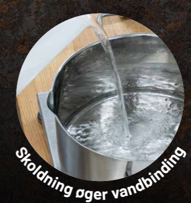
Skoldning øger vandbinding

“ Ved de søde typer dej fungerer melet super godt. Man smager ikke, at der er tilsat fuldkorn, og det kan derfor bruges i det søde køkken uden at påvirke smag eller konsistens i det færdige produkt. ”