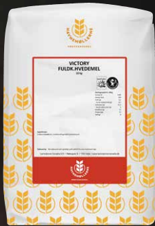
Victory Fuldkornshvedemel N+ 10 kg Varenr. 141662