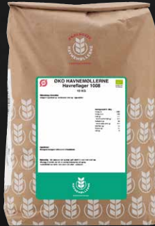
Øko Havreflager/Grovv. Havregryn 1008 10 kg Varenr. 140121