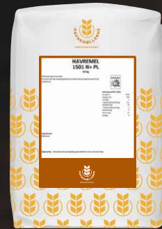
Havremel 1501 PL N+ 10 kg Varenr. 141612