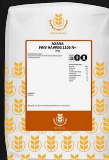
Finv. Havregryn N+ 10 kg Varenr. 140224