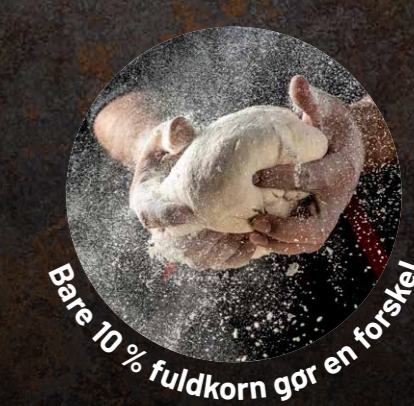
Bare 10 % fuldkorn gør en forskel