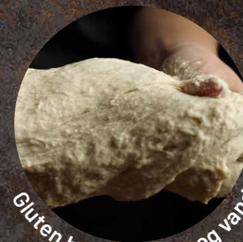
Gluten holder på luft og vand