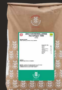
Øko Havreflager/ Grovv. Havregryn 1008 Varenr. 140121