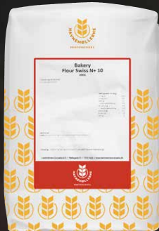
Bakery Flour Swiss N+ HM 10 kg Varenr. 142251