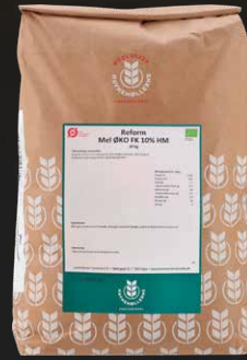
Øko Reform Hvedemel m. FK 10% N+ 10 kg Varenr. 142481