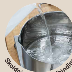
Skoldning øger vandbinding

Når tid og teknik gør arbejdet. God struktur, lang friskhed og høj saftighed opstår ikke tilfældigt. De opstår, når man arbejder med naturlige processer som: