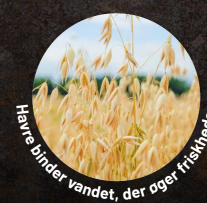
Havre binder vandet, der øger friskheden