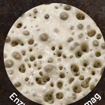
Enzymer udvikler smag