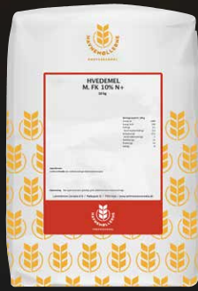
Hvedemel m. FK 10% N+ 10 kg Varenr. 142451