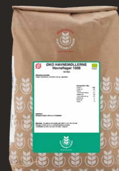
Øko Havremøllerne/ Grovv. Havregryn 1008 Varenr. 140121