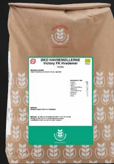
Øko Victory Fuldkornshvedemel 10 kg Varenr. 142108