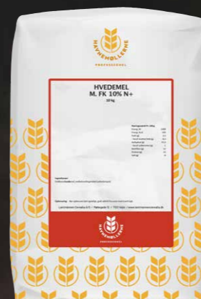
Hvedemel m. FK 10% N+ 10 kg Varenr. 142451

Sådan er vores hvedemel med 10 % fuldkorn udviklet: