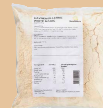
White Magic 6 kg pose Varenr. 142072