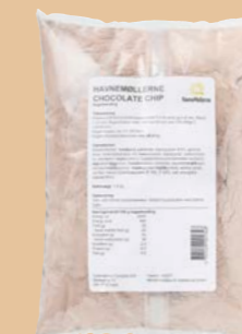
Chocolate Chip 4 x 1,8 kg pose Varenr. 142071