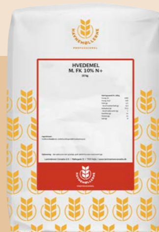
Hvedemel m. FK 10% N+ 10 kg Varenr. 142451