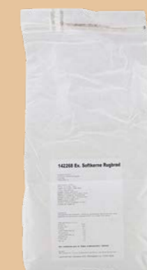
Ekstra Softkernerugbrød 10 kg pose Varenr. 142268