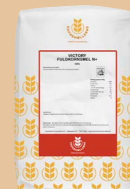
Victory fuldkornsmel N+ 10 kg pose Varenr. 141662