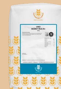
UNO Skåret Rug 3200 N+ 10 kg pose Varenr. 141526