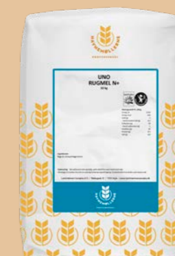
UNO Rugmel N+ 10 kg pose Varenr. 141515