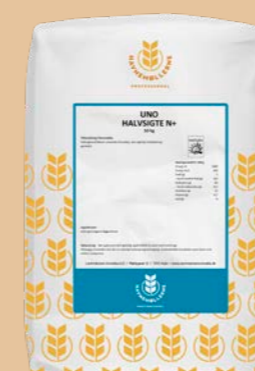
UNO Halvsigte N+ 10 kg pose Varenr. 141517