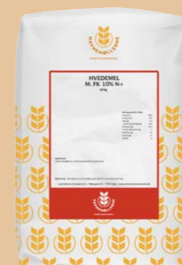
Hvedemel m. FK 10% N+ 10 kg pose Varenr. 142451

Dækker hele dit brødbehov. Der er noget for enhver smag.