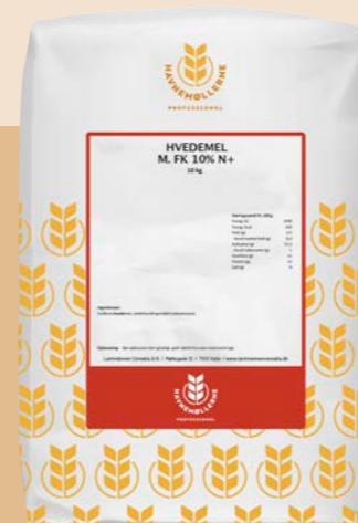
Hvedemel m. FK 10% N+ 10 kg Vare nr. 142451