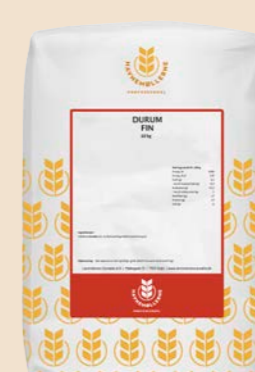
Durum semolina hvedemel 10 kg pose Varenr. 141901