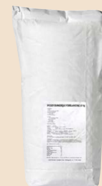
Donkerque forblanding 10 kg pose Varenr. 141529