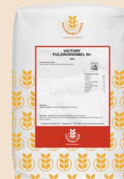
Victory fuldkornsmel N+ 10 kg pose Varenr. 141662