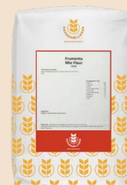
Frumenta Mie Flour 10 kg pose Varenr. 142210