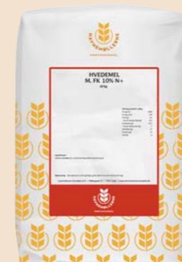
Hvedemel m. FK 10% N+ 10 kg pose Varenr. 142451

Dækker hele dit brødbehov. Der er noget for enhver smag.