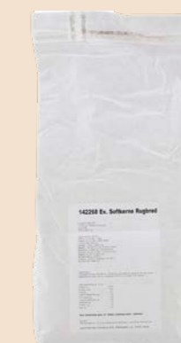
Ekstra Softkernerugbrød 10 kg pose Varenr. 142268